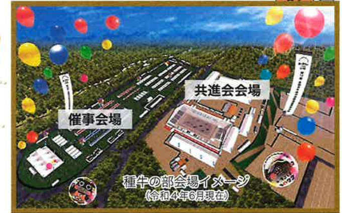
種牛の部会場イメージ (令和4年6月現在)