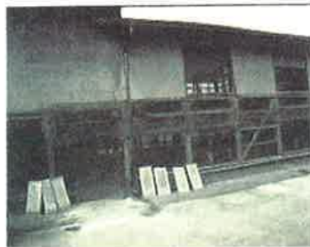
牛舎の様子(青いメッシュとハエ取紙)