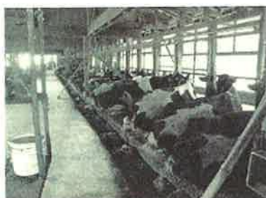
ゆったり横臥する牛