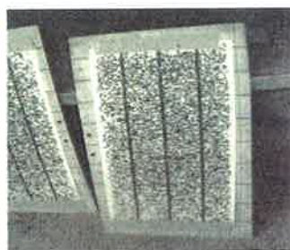
ハエ取り紙に黒々とサシバエ

平成19年の春ごろ青年部の同世代の仲間から「メッシュが有効みたいだぞ!!」「育成舎に張ったら、効果があった」と聞いて、早速メッシュの全面張りを実施しました。