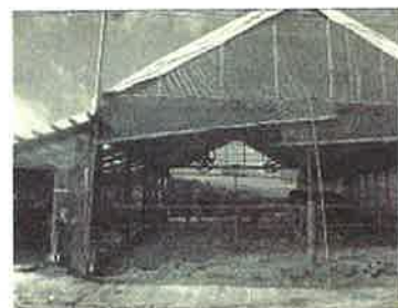
分娩舎のメッシュ