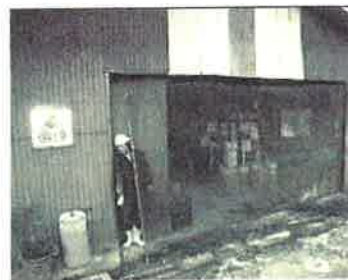
入口のカーテン仕様