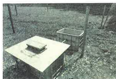
給水マス（手前）と飲水マス（奥）